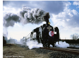
真岡鐵道イベントヘッドマーク (2005年)