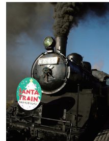
真岡鐵道イベントヘッドマーク (2008年)