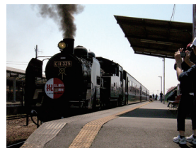
真岡鐵道イベントヘッドマーク (2010年)